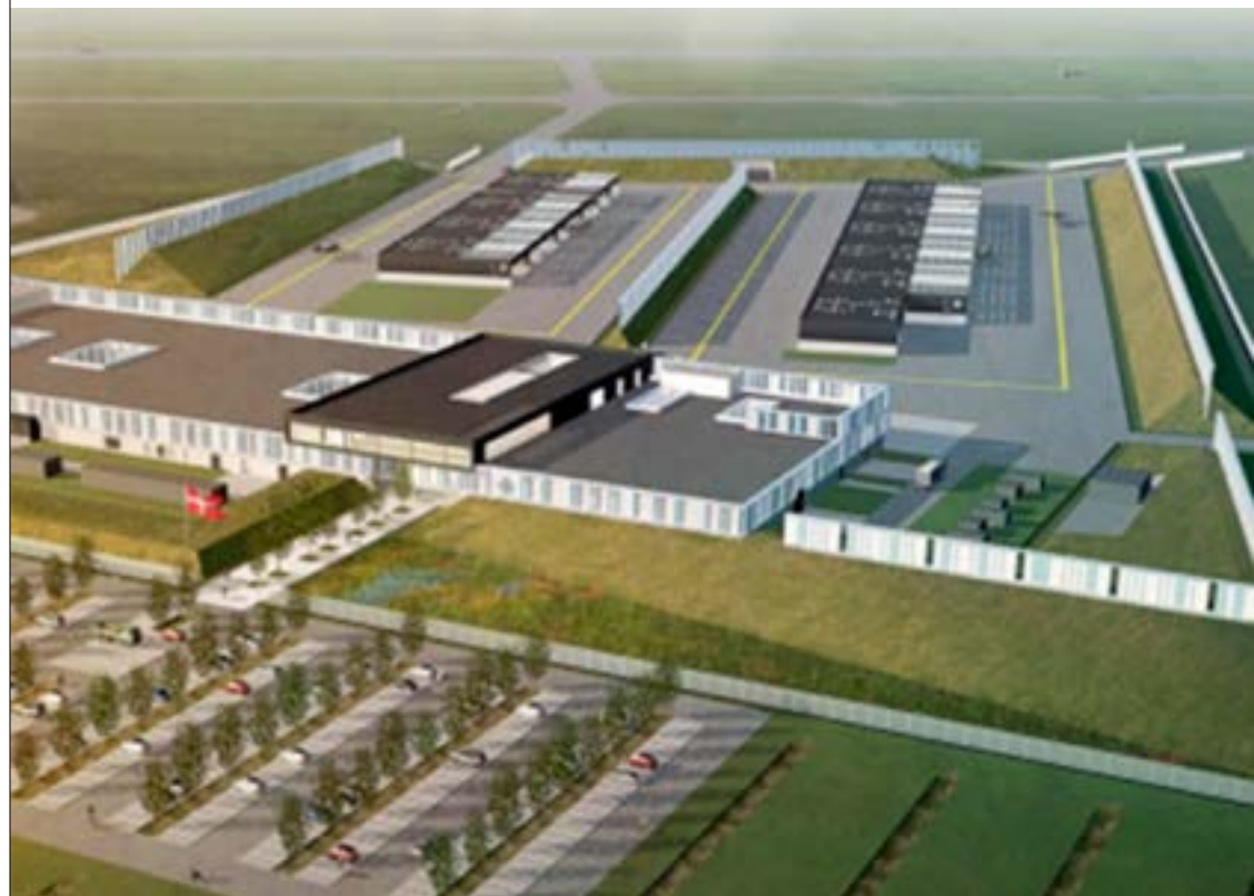
F-35 Campus skal stå færdigt til at tage imod det første fly i 2023.